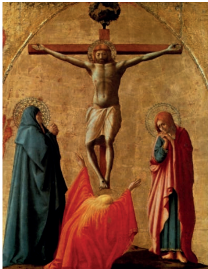
Masaccio, Crocifissione , dal Polittico di Pisa (1426), tempera su tavola (Napoli, Museo di Capodimonte)

In una tavoletta di piccole dimensioni, che costituiva la parte apicale (a circa cinque metri di altezza, con una visione scorciata dal basso resa attraverso l'abbreviazione delle gambe di Cristo e la testa incassata sulle spalle) del polittico dipinto per il Carmine di Pisa, l'allora venticinquenne Masaccio imposta una scena dal potente carico drammatico inserendo, nella raffigurazione della croce, i tre testimoni storici della crocifissione modellati con forti contrasti messi in risalto dalla decorazione ad oro e dai colori degli abiti: la Madonna, salda come una roccia, avvolta nel suo manto blu notte ha lo sguardo fermo, il volto impietrito e le mani