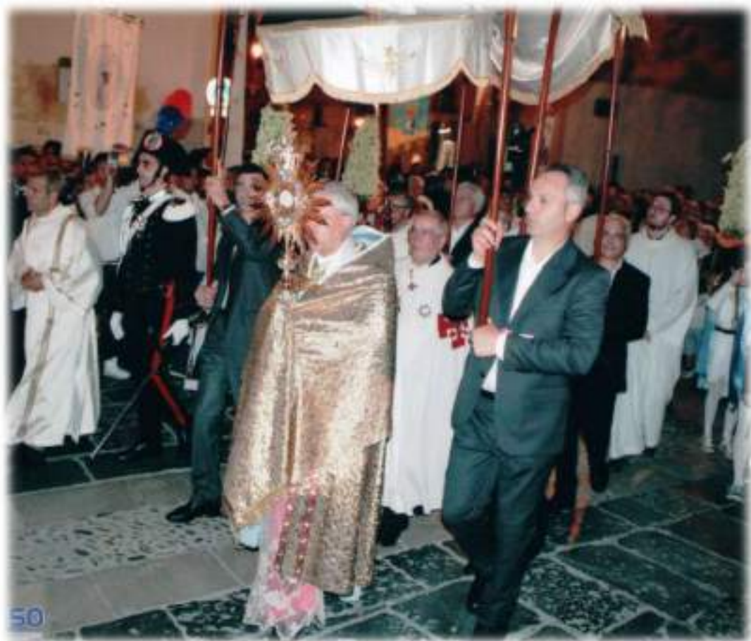
Corpus Domini - Domenica 29 Maggio 2016