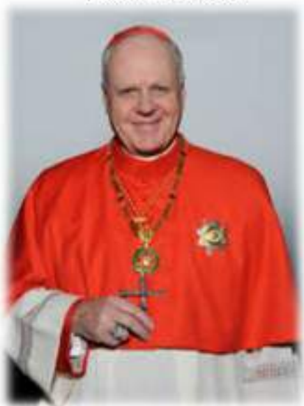
S. Em. Card. Edwin Frederic O' Brien Gran Maestro O.E.S.S.G.