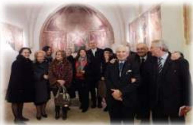
Gemellaggio tra le Delegazioni di Bari - Bitonto e Cerignola -Ascoli Satriano Domenica 7 Febbraio 2016