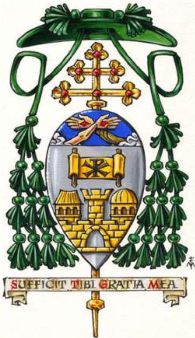
Stemma Episcopale Arcivescovo Pierbattista Pizzaballa