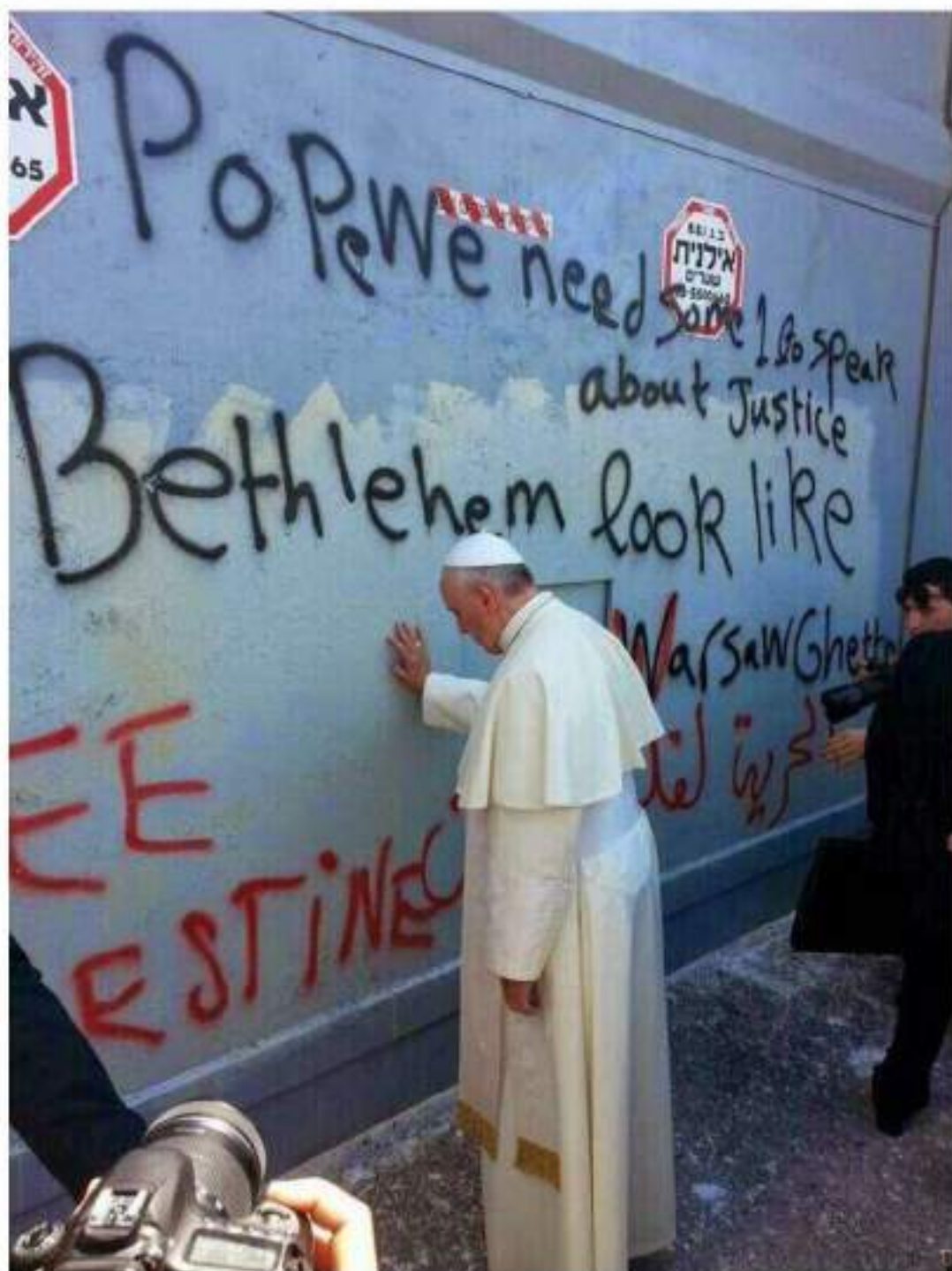
Papa Francesco a Betlemme prega sul muro che divide Israele e Palestina - 25 Maggio 2014