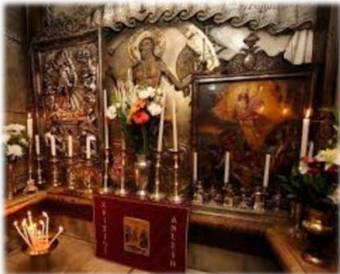
Interno Edicola della Basilica del Santo Sepolcro