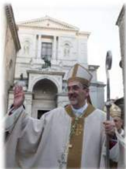
S. E. Mons. Pierbattista Pizzaballa Amministratore Apostolico del Patriarcato Latino di Gerusalemme Pro Gran Priore O.E.S.S.G.