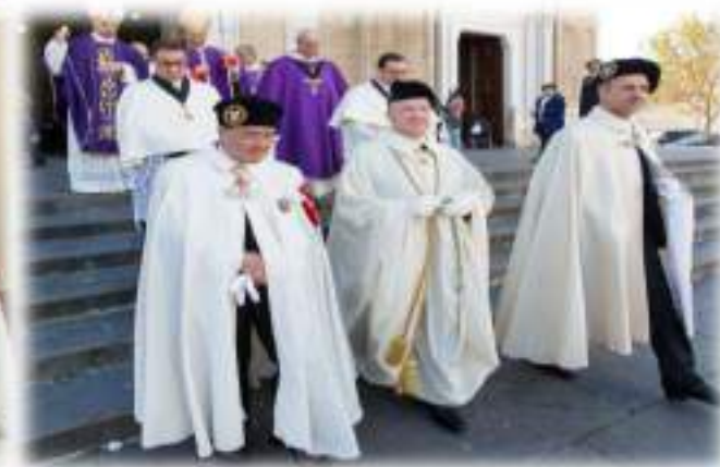
VIII Cerimonia di Investitura e Promozioni Basilica Cattedrale di San Pietro Apostolo in Cerignola - Domenica 27 Novembre 2016