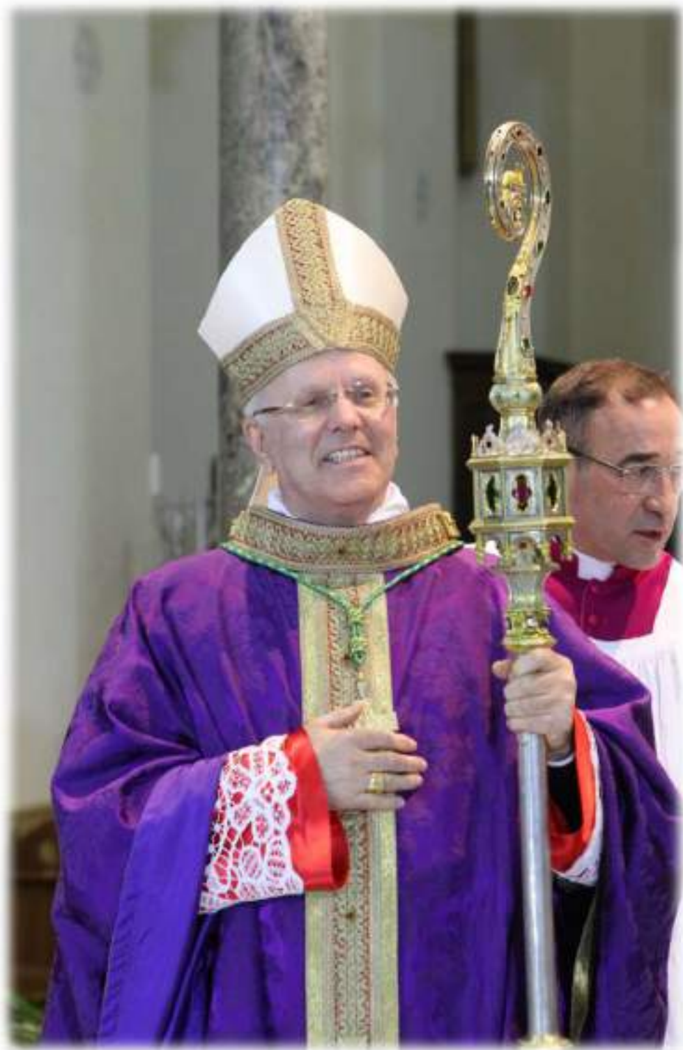
S. E. Mons. Nunzio Galantino Segretario Conferenza Episcopale Italiana Presiede l'Ordinazione Episcopale di Mons. Luigi Mansi