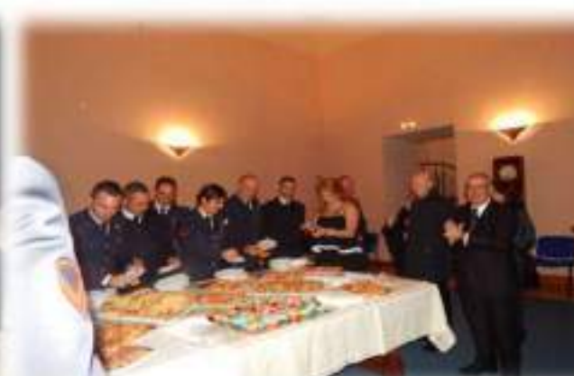
Teatro "S. Mercadante" Cerignola - Sabato 29 Ottobre 2016