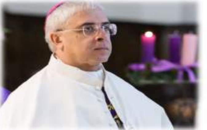
VIII Cerimonia di Investitura e Promozioni Basilica Cattedrale di San Pietro Apostolo in Cerignola - Domenica 27 Novembre 2016