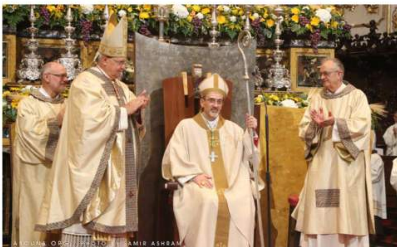
Ordinazione Episcopale di Mons. Pierbattista Pizzaballa Bergamo - Cattedrale di Sant'Alessandro Sabato 10 Settembre 2016.