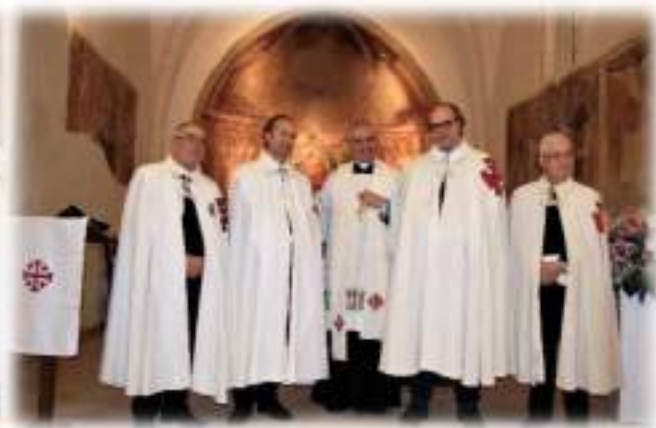
VIII Veglia d'armi o di preghiera Chiesa di Santa Maria delle Grazie in Cerignola Venerdì 25 Novembre 2016