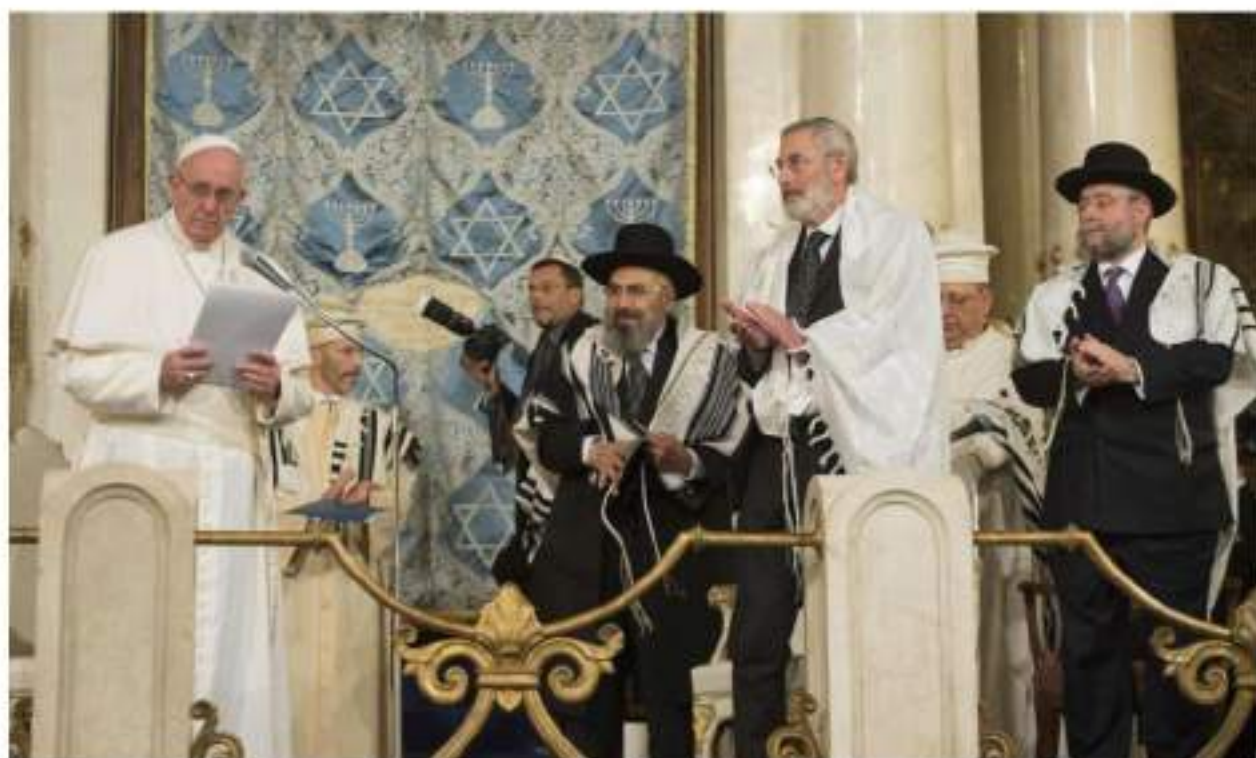
Papa Francesco in visita alla Sinagoga di Roma - 17 Gennaio 2016