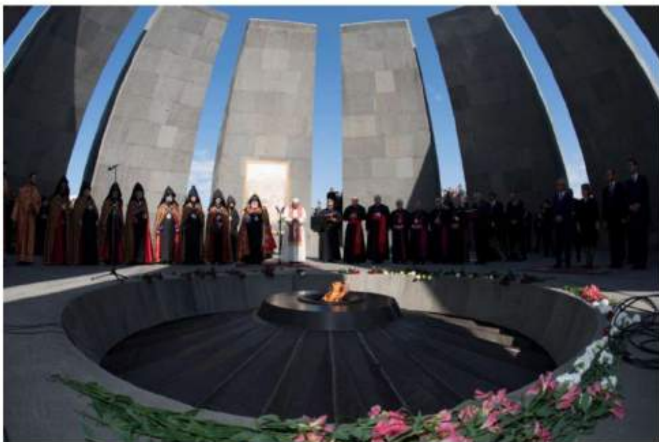
Papa Francesco in Armenia prega al "Memoriale del genocidio" Sabato 25 Giugno 2016