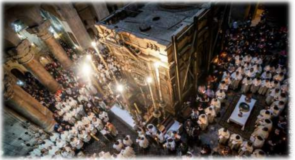
Basilica del Santo Sepolcro Veglia Pasquale A.D. 2016