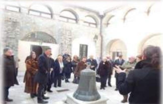
Gemellaggio tra le Delegazioni di Bari - Bitonto e Cerignola Ascoli Satriano Domenica 7 Febbraio 2016