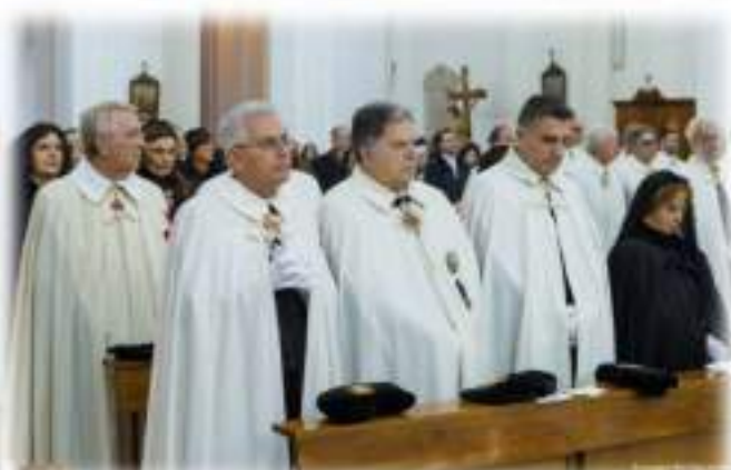
VIII Cerimonia di Investitura e Promozioni Basilica Cattedrale di San Pietro Apostolo in Cerignola - Domenica 27 Novembre 2016