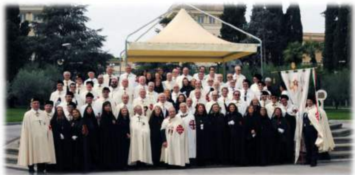
Giubileo Nazionale della Misericordia a Pompei