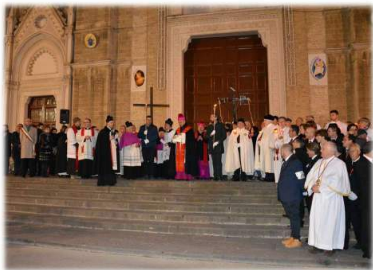
Via Crucis cittadina - Venerdì 25 Marzo 2016