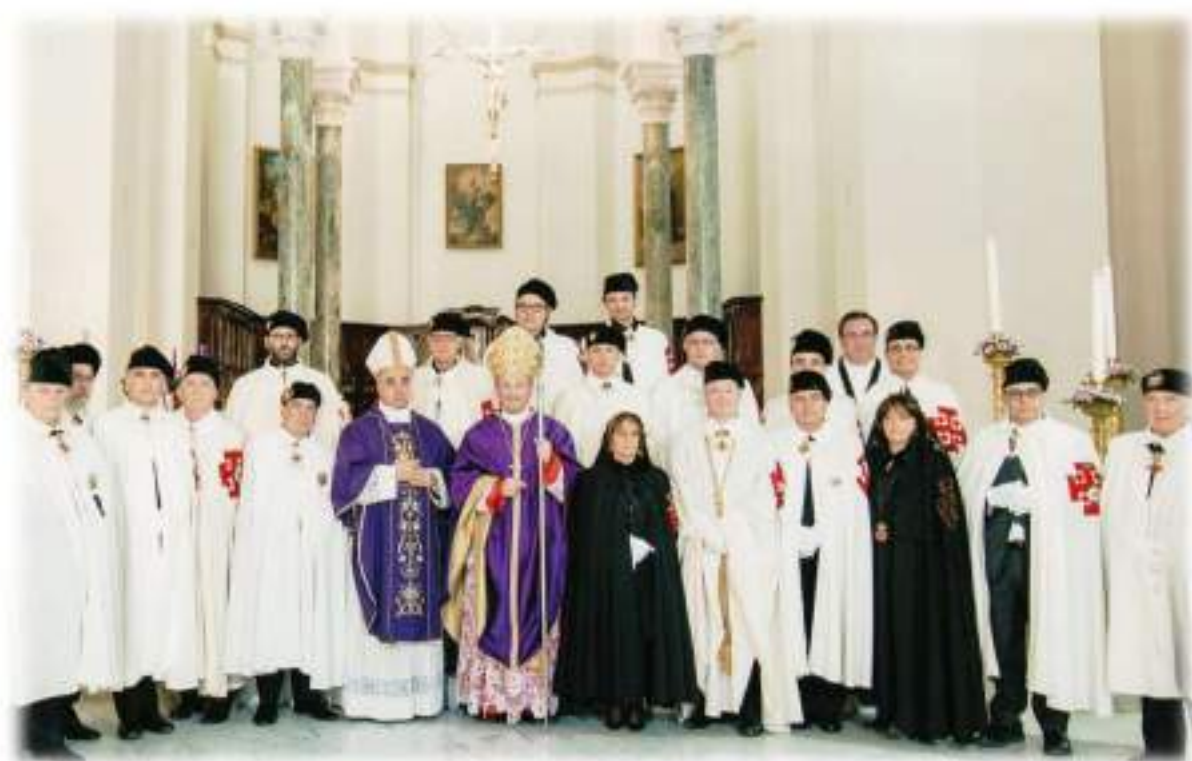
VIII Cerimonia di Investitura e promozione Basilica Cattedrale S. Pietro Apostolo - Cerignola 27 Novembre 2016