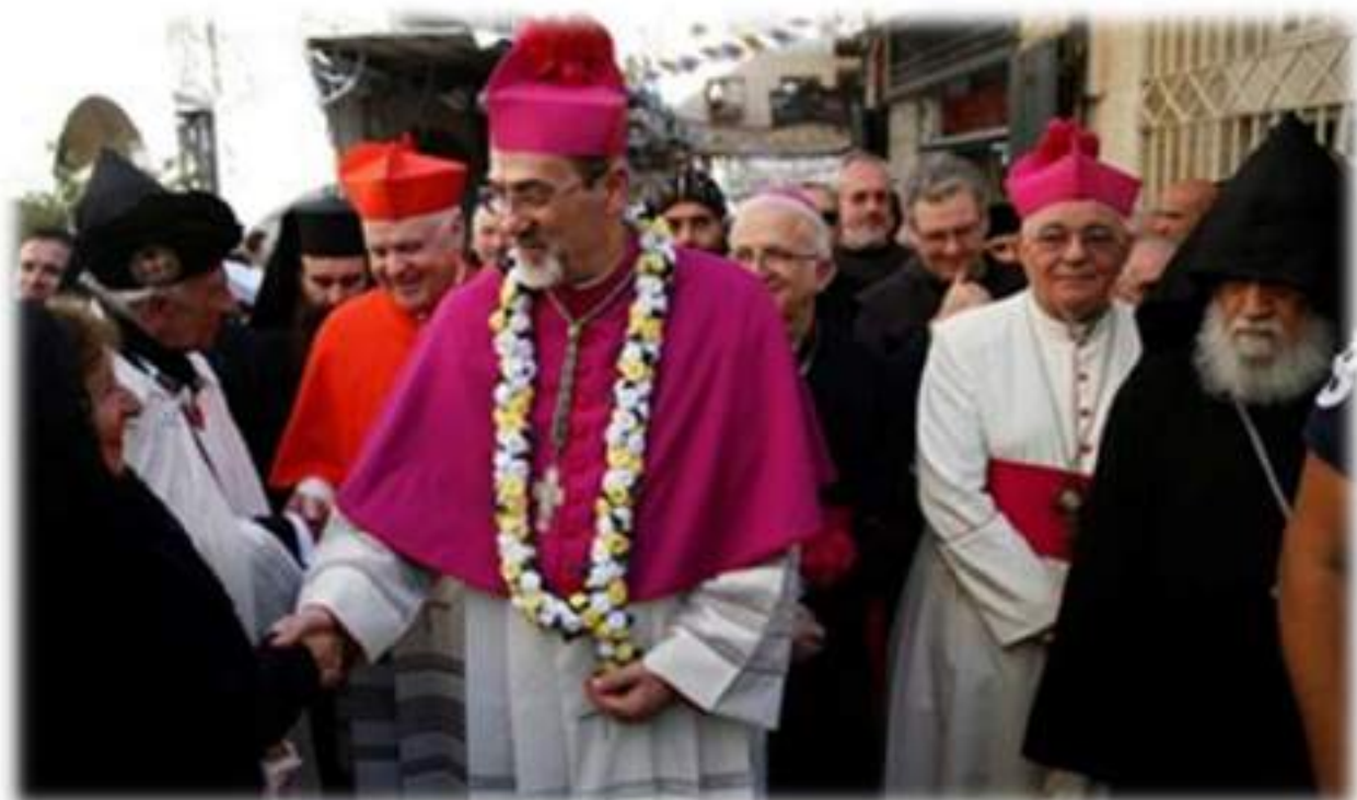
Ingresso solenne dell'Arcivescovo Pierbattista Fizzaballa a Gerusalemme accompagnato dal Cardinale Edwin Frederic O'Brien, Gran Maestro dell'O.E.S.S.G. - Mercoledì 21 settembre 2016