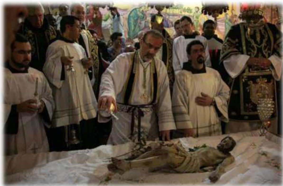
Basilica del Santo Sepolcro di Gerusalemme Servizio funebre del Venerdì Santo A.D. 2014