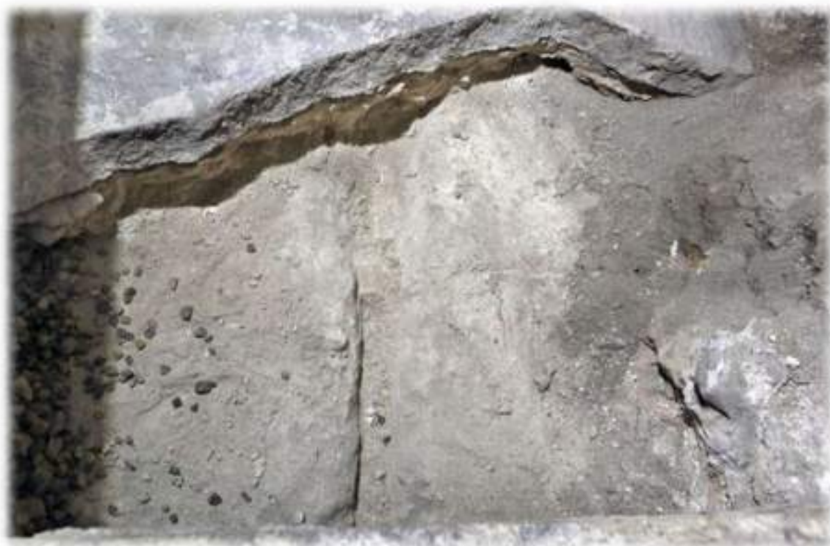
Letto funebre di Gesù