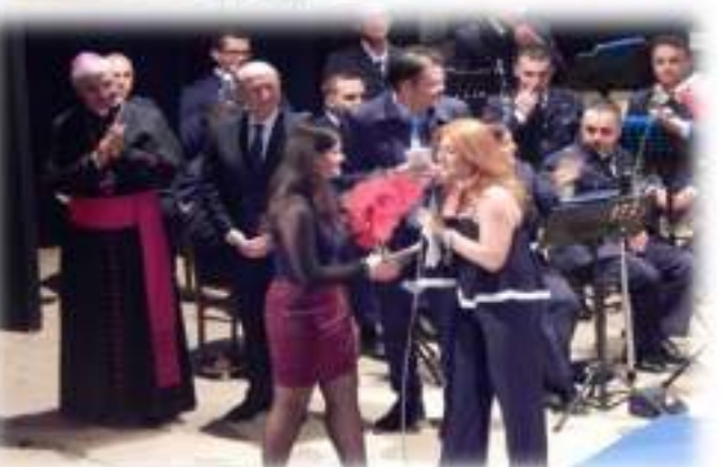
Teatro "S. Mercadante" Cerignola - Sabato 29 Ottobre 2016