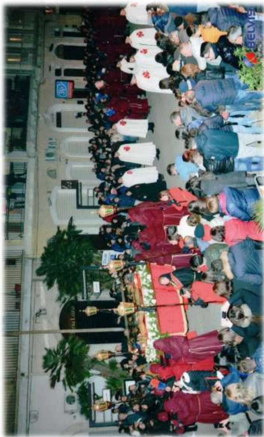
Processione di Gesù Morto - Venerdì Santo 25 Marzo 2016