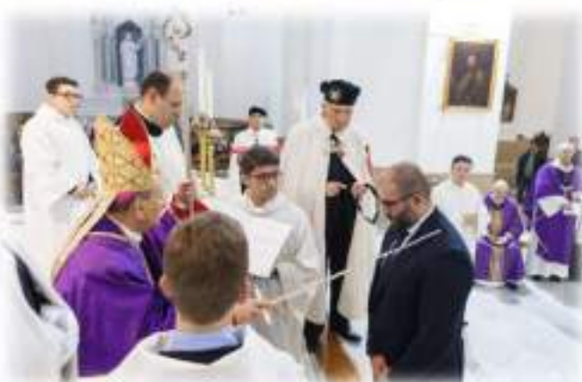
VIII Cerimonia di Investitura e Promozioni Basilica Cattedrale di San Pietro Apostolo in Cerignola - Domenica 27 Novembre 2016