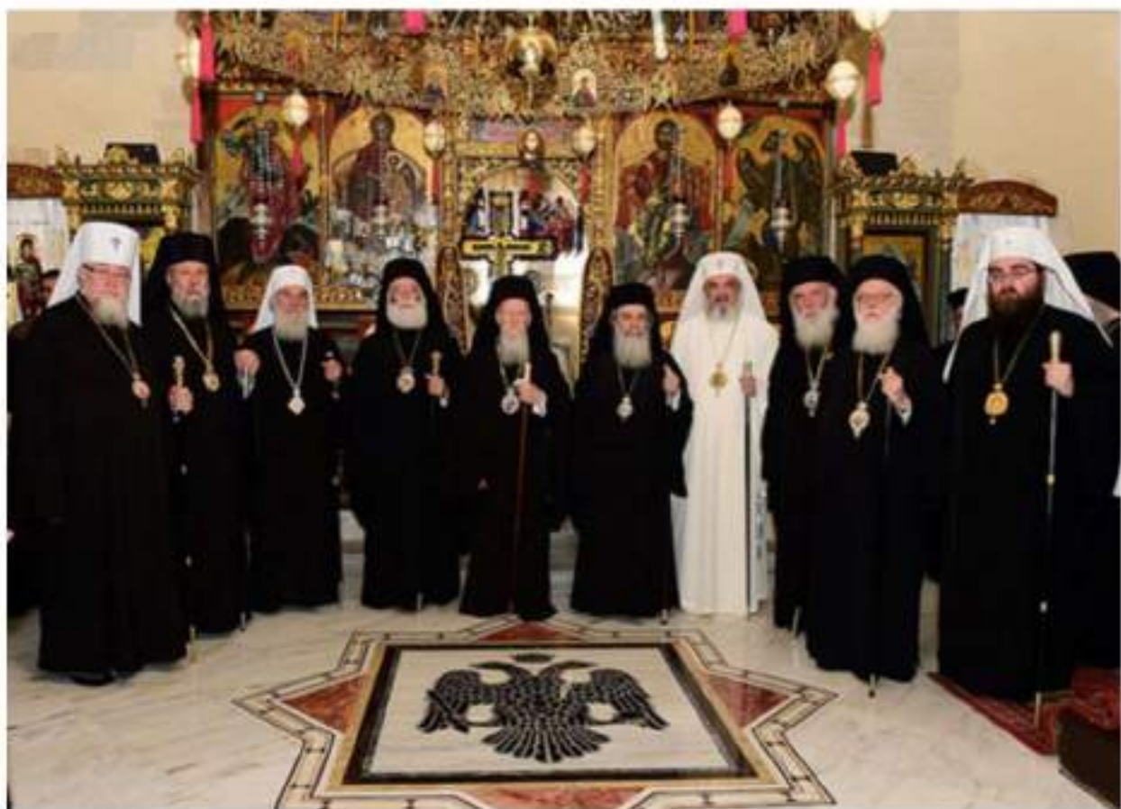
Patriarchi partecipanti al Concilio pan ortodosso a Creta dal 19 al 25 Giugno 2016