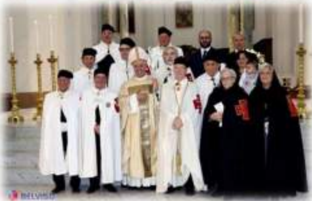
Festa in onore di N. S. Regina della Palestina e del Ventennale di Istituzione della Delegazione Cattedrale di San Pietro Apostolo in Cerignola - Sabato 29 Ottobre 2016