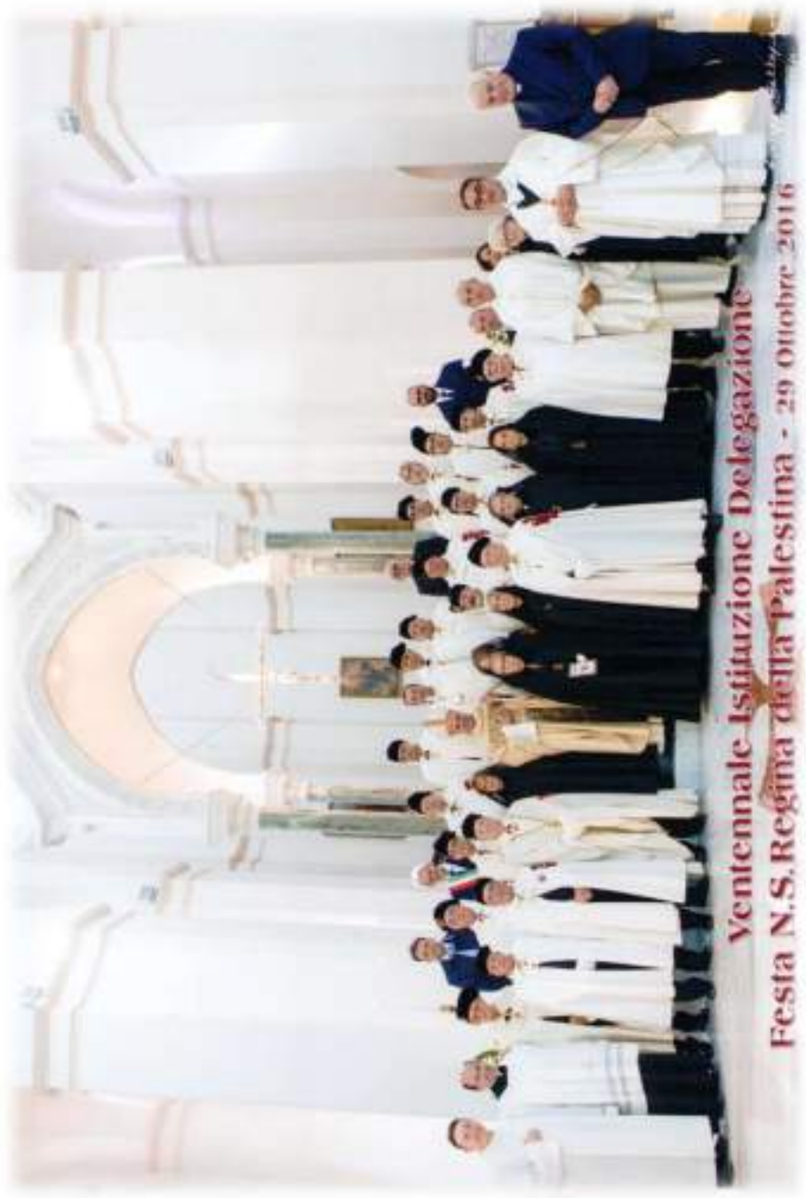
Ventennale Istituzione Delegazione Festa N.S. Regina della Palestina - 29 Ottobre 2016